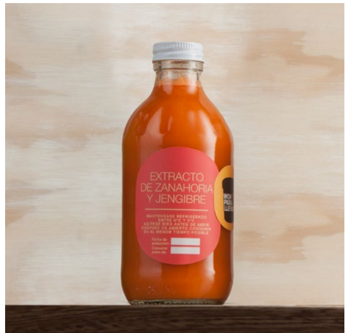
EXTRACTO DE ZANAHORIA Y JENGIBRE $10.200