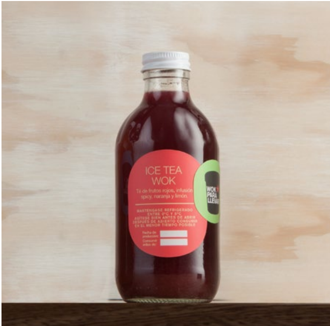
ICE TEA WOK Té de frutos rojos con infusión spicy, naranja y limón. $14.900