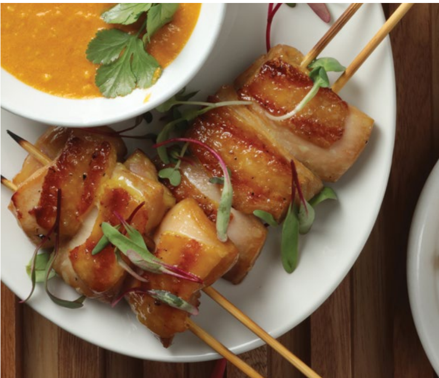
SATAY CONTRAMUSLO DE POLLO Marinados con una infusión de salsa soya y servidos con salsa a base de leche de coco y maní. $27.900