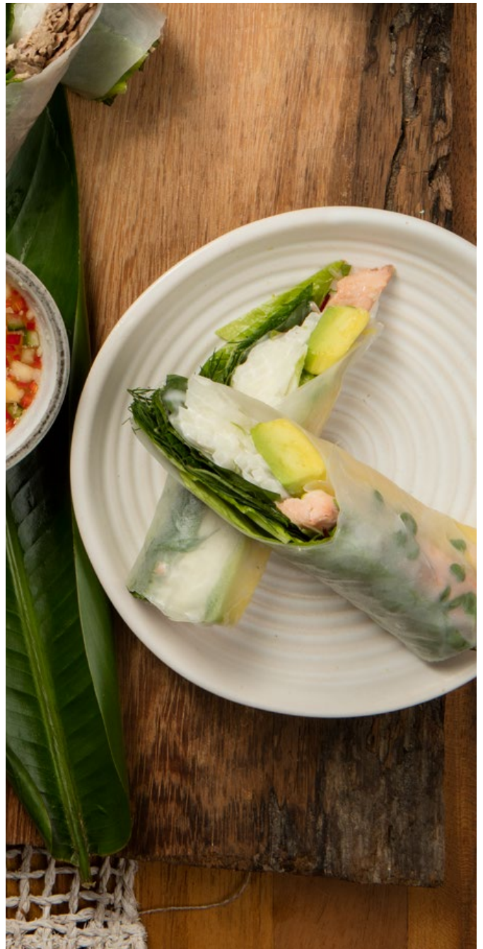
ROLLITOS DE PAPEL DE ARROZ DE TRUCHA Trucha ahumada, lechuga, jícama remoulade, mayonesa, aguacate, hierbas y germinados. Servidos con salsa vietnamita con nam-pla y maní. $29.900