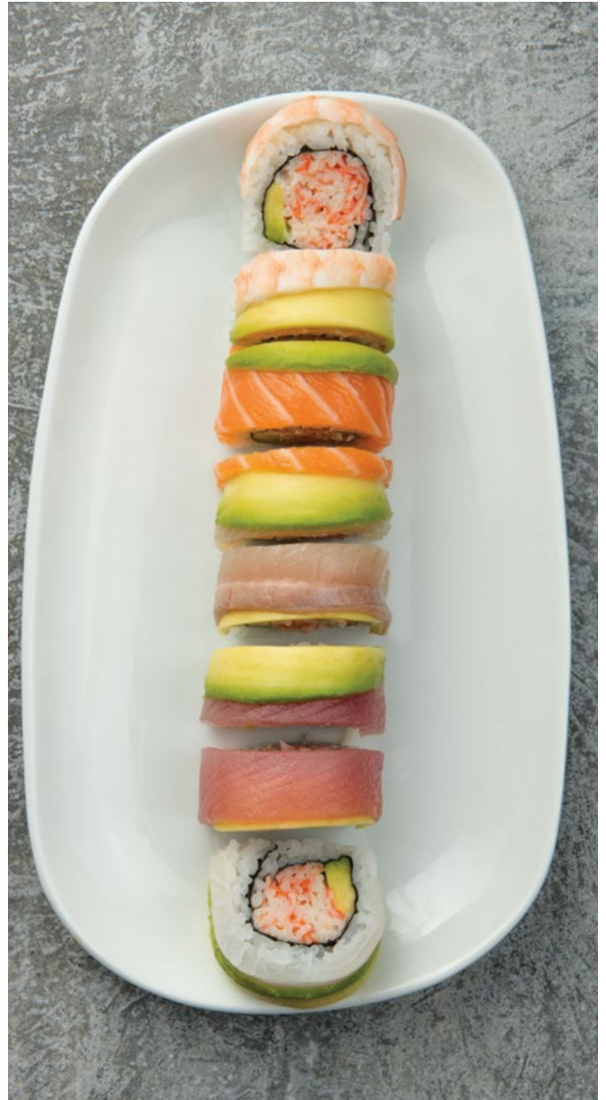
RAINBOW MAKI 🍣🍣 (8u) Camarón, palmito de cangrejo y mayonesa, envueltos en salmón, trucha, langostino, aguacate y pescado. $39.900