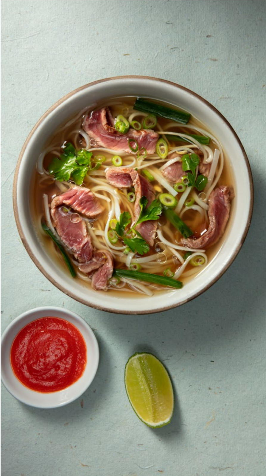
VIETNAMITA CON CADERA DE RES Consomé de pollo, con pasta de arroz, salsa de ostras, cebollín oriental y cilantro. Servida con salsa sriracha y limón. $37.900