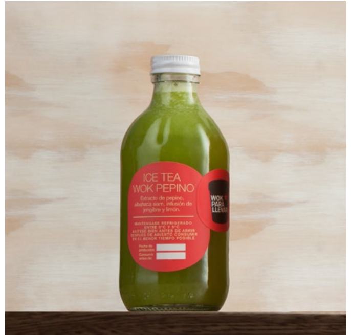
ICE TEA WOK PEPINO Extracto de pepino, albahaca siam, infusión de jengibre y limón. $11.900