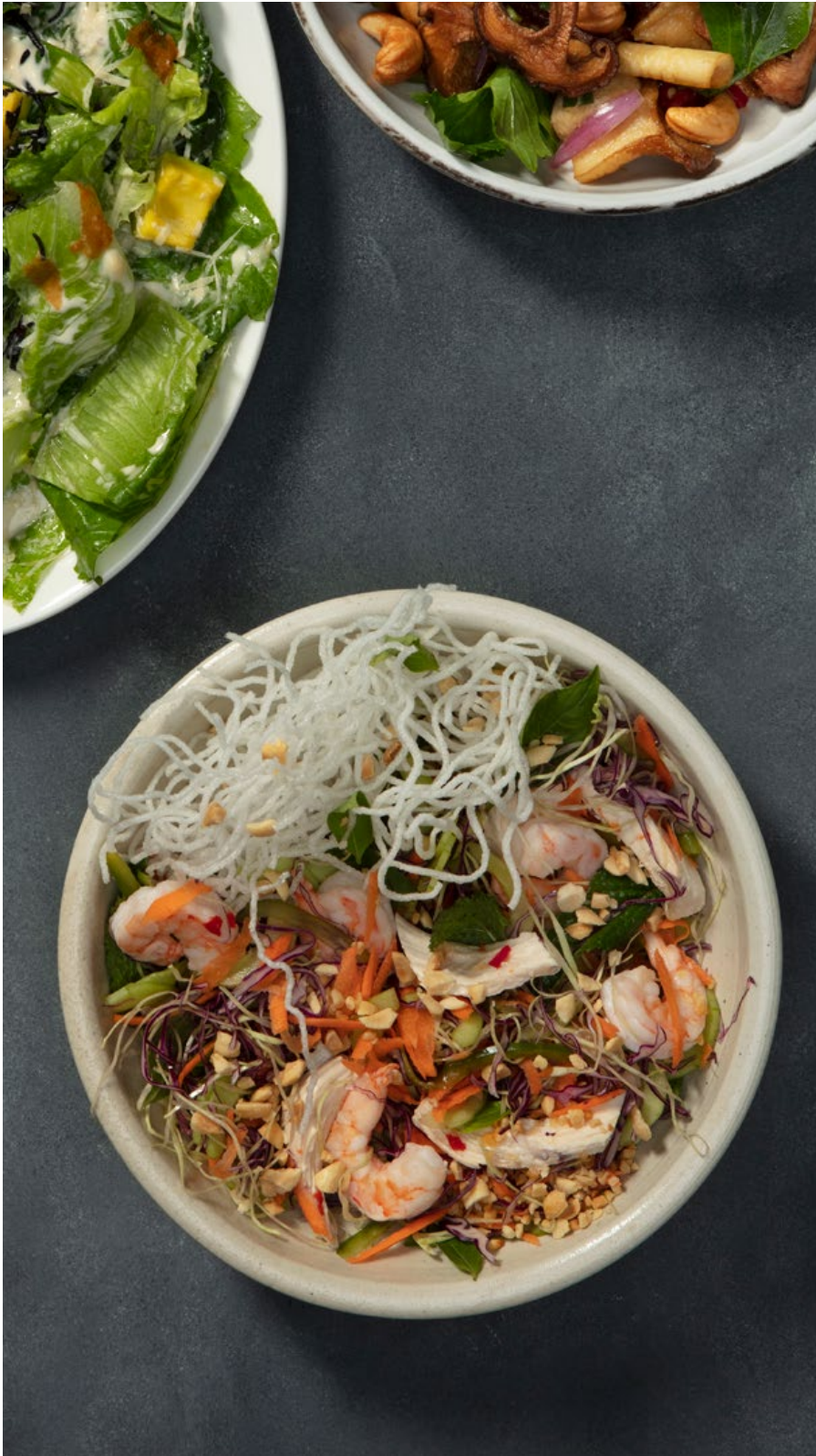
CRISPY NOODLES Camarones, pechuga de pollo, pasta vermicelli crocante, vegetales, albahaca siam, hierbabuena, maní y vinagreta vietnamita con chile y nam-pla. $37.900