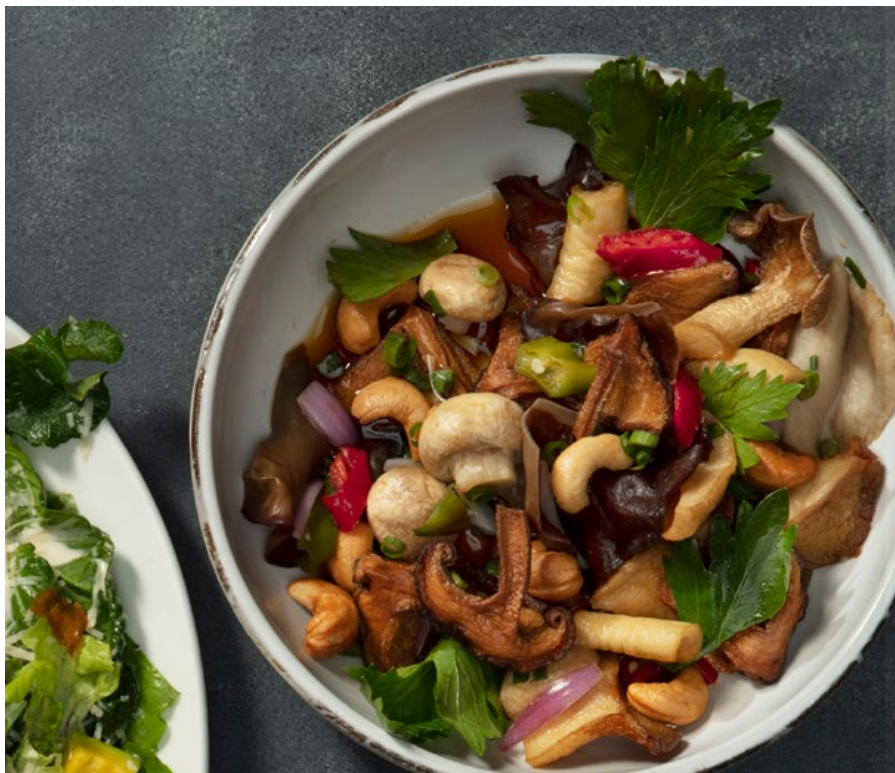
SETAS THAI 🔥 Variedad de setas, cebolla ocañera, chile, marañón, cebollín oriental, hojas de apio, ajo y vinagreta thai con salsa soya. $39.900