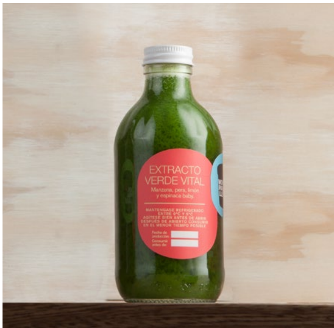
EXTRACTO VERDE VITAL Extracto de manzana, pera, limón y espinaca baby. $16.700