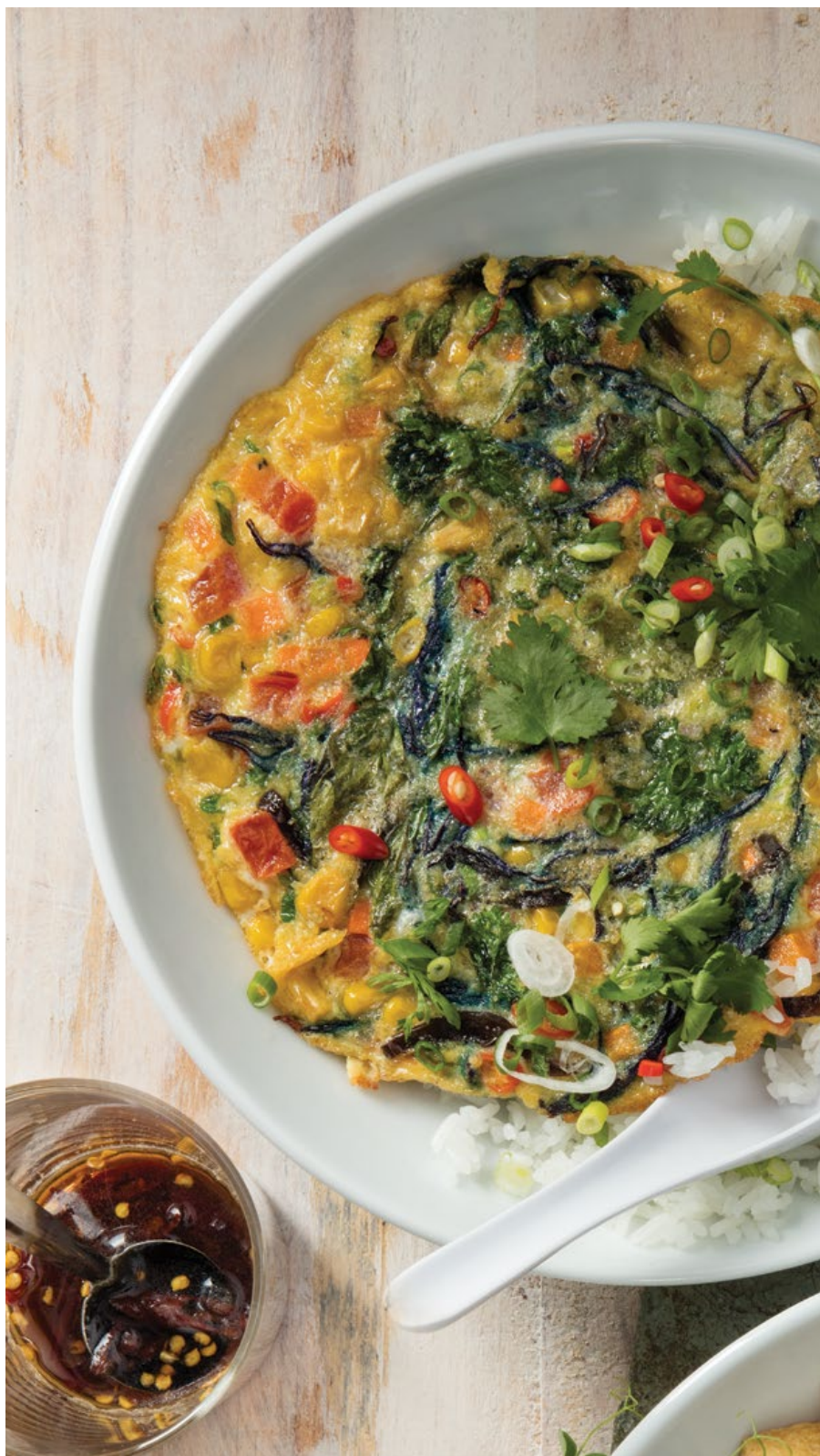
OMELETTE THAI 🔥 Tortilla de huevo con vegetales, albahaca siam, cilantro, setas (oreja de madera), chile y salsa soya. Servido sobre arroz jasmín o integral. $19.900