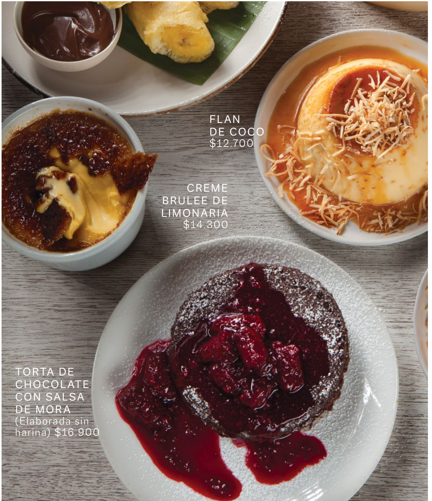
FLAN DE COCO $12.700