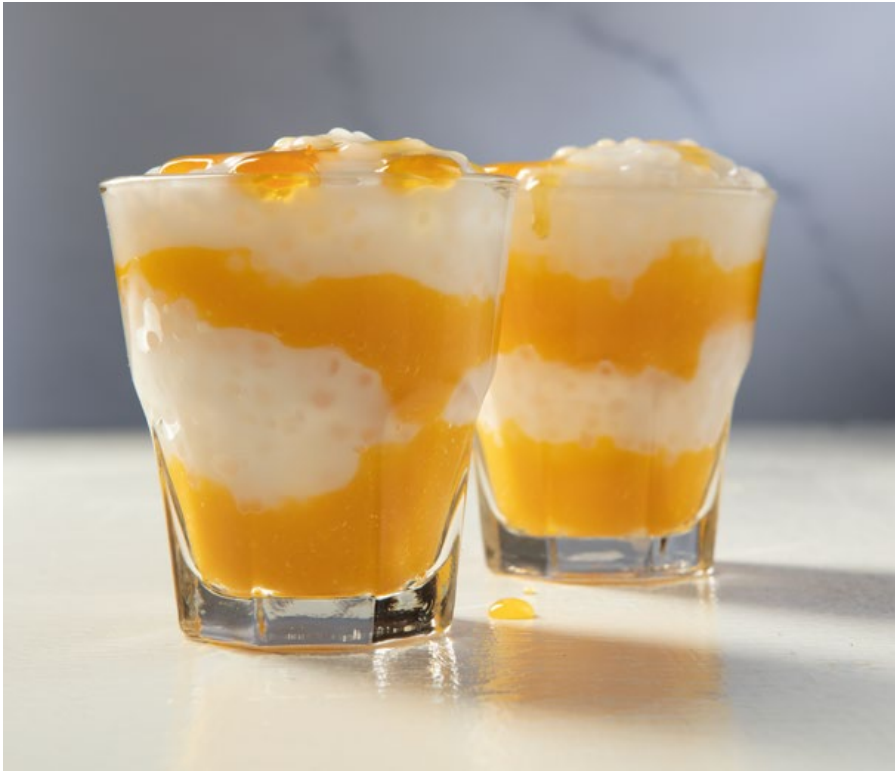
TAPIOCA CON MANGO $9.200