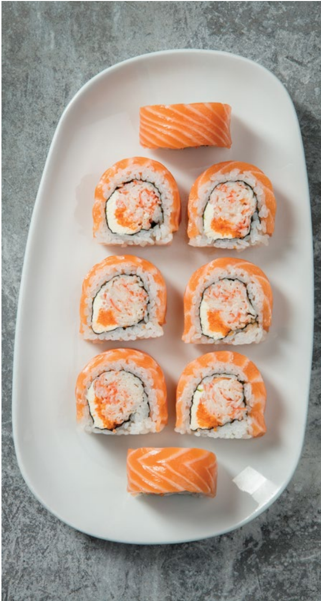
WOK MAKI SALMÓN 🍣 (8u) Palmito de cangrejo, queso crema y masago, envuelto en salmón. $39.900 CON TRUCHA $34.900