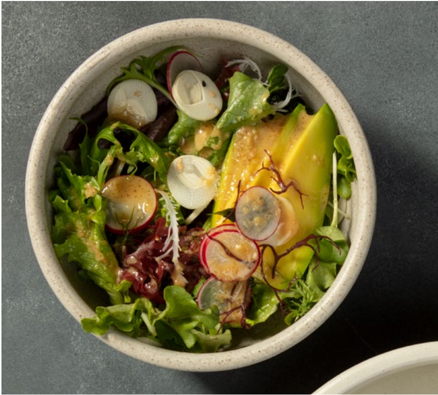
ENSALADA CON AGUACATE Y ALGAS Mezcla de lechugas orgánicas, aguacate, palmito del Putumayo, ajonjolí, rábano y algas con vinagreta de jengibre. $23.900