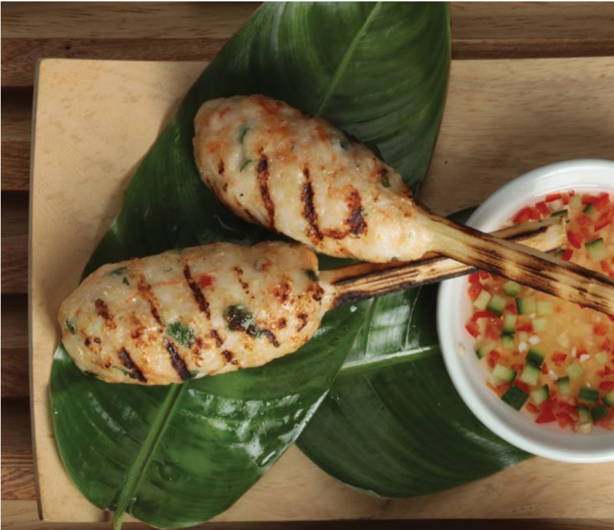
CHAO TOM Camarones aromatizados en caña de azúcar, servidos con salsa vietnamita con nam-pla y maní. $29.900