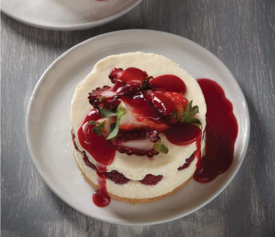
CHEESECAKE DE FRUTOS ROJOS $17.900