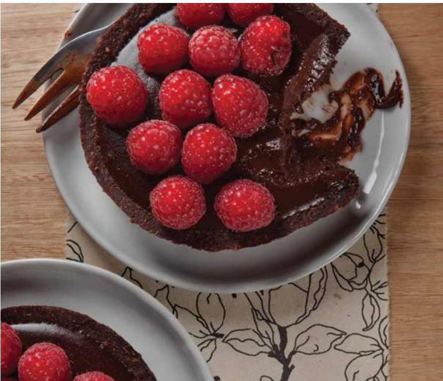
TARTELETA DE CHOCOLATE Galleta de nueces, dátiles y coco, rellena de crema de marañón, cocoa, miel y frambuesas o arándanos (según temporada). (Elaborado sin harina). $18.900