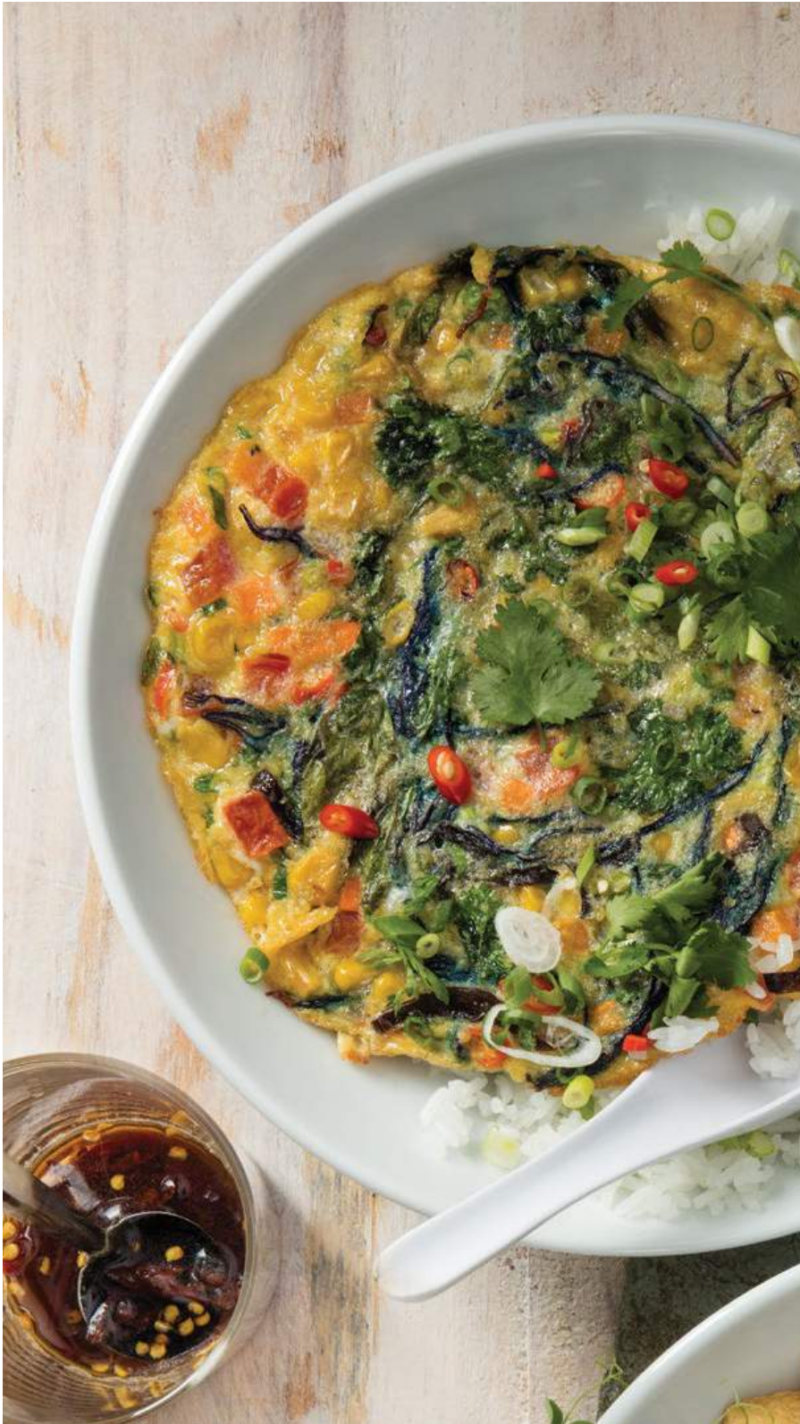
OMELETTE THAI 🔥 Tortilla de huevo con vegetales, albahaca siam, cilantro, setas (oreja de madera), chile y salsa soya. Servido sobre arroz jasmín o integral. $18.900