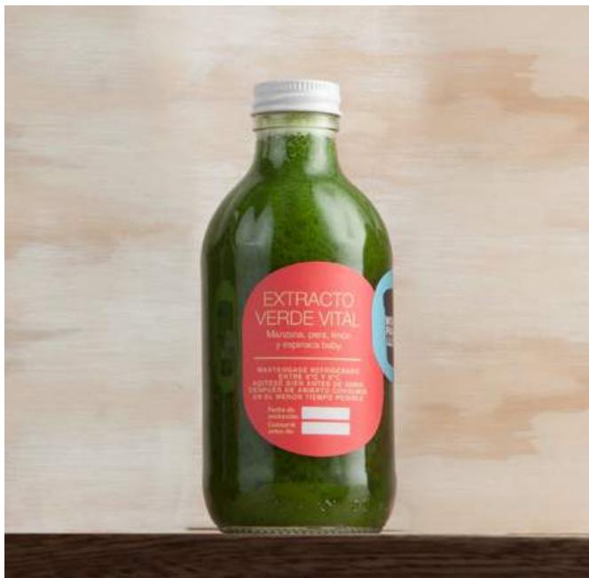
EXTRACTO VERDE VITAL Extracto de manzana, pera, limón y espinaca baby. $15.900