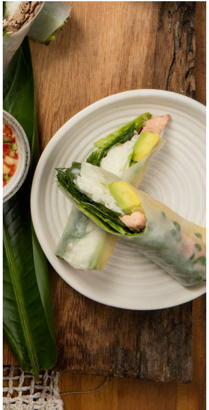
ROLLITOS DE PAPEL DE ARROZ DE TRUCHA Trucha ahumada, lechuga, jícama remoulade, mayonesa, aguacate, hierbas y germinados. Servidos con salsa vietnamita con nam-pla y maní $27.900