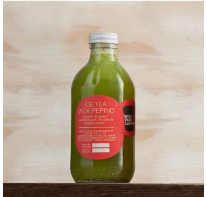
ICE TEA WOK PEPINO Extracto de pepino, albahaca siam, infusión de jengibre y limón. $11.600