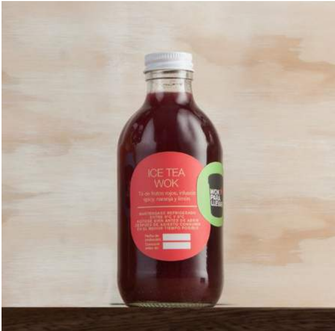
ICE TEA WOK Té de frutos rojos con infusión spicy, naranja y limón. $13.900